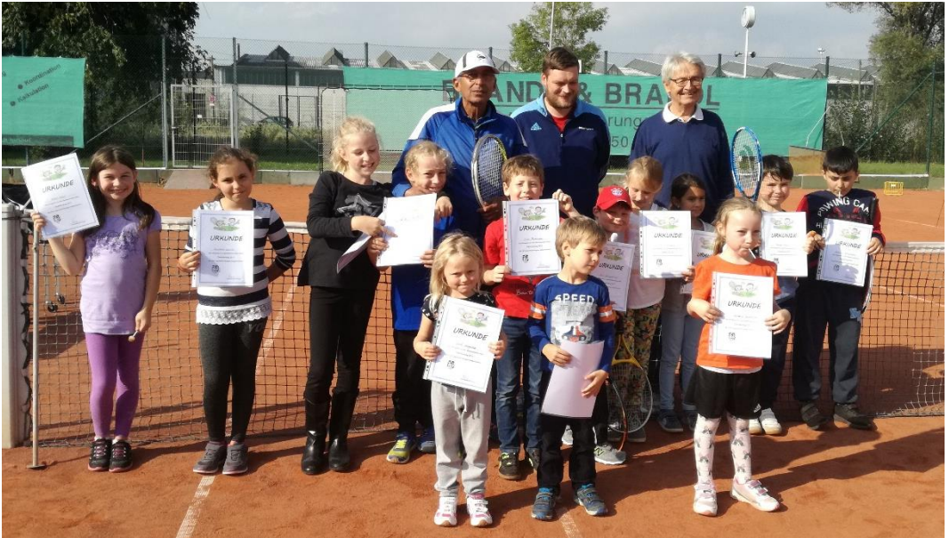
Stolze Teilnehmer am Familientag mit ihren Urkunden