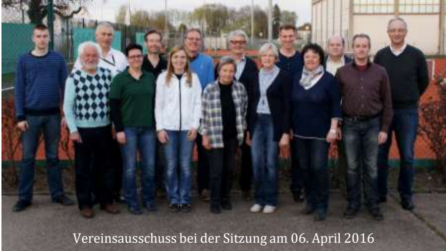
Vereinsausschuss bei der Sitzung am 06. April 2016