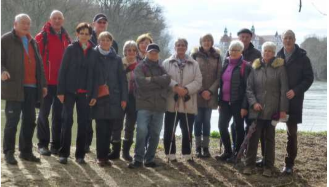
Winterwanderung von Joshofen nach Neuburg zum Kaffeetrinken.